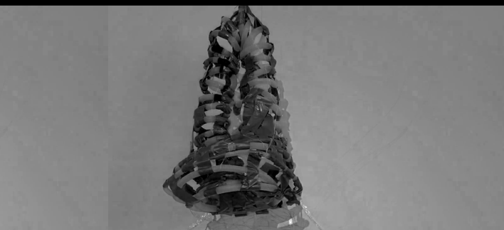
PROJEKT GRUPY II